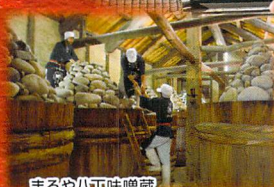
まるや八丁味噌蔵