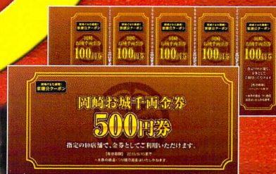
岡崎お城千両金券