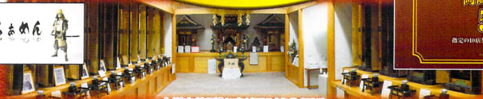
大樹寺特別「お宝」拝観(宝物拝観)