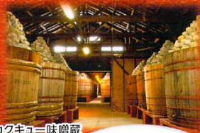
カクキュー味噌蔵